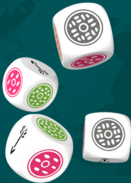
Dés 16 mm