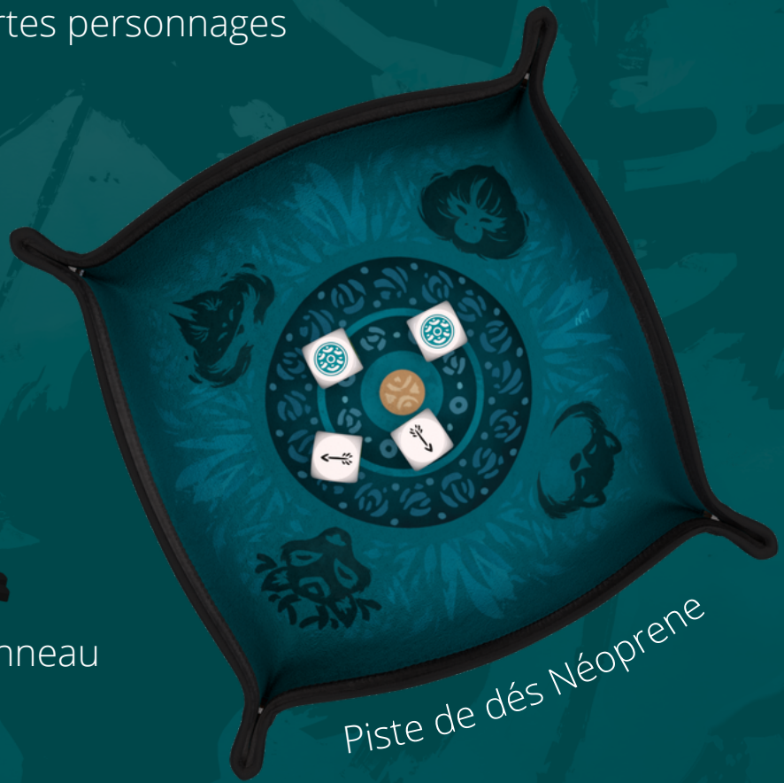
Piste de dés Néoprene