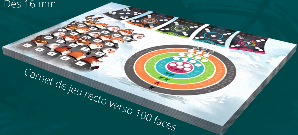
Carnet de jeu recto verso 100 faces